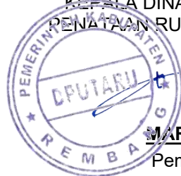
MARYOSA, A.TD, M.T.

Mengetahui, KEPALA DINAS PEKERJAAN UMUM DAN PENATAAN RUANG KABUPATEN REMBANG